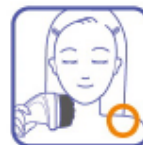
используйте защитную насадку, чтобы не повредить волосы

Не используйте прибор без защитной насадки в тех местах, где волосы могут попасть в прибор (шея или плечи).