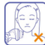
неправильное использование прибора